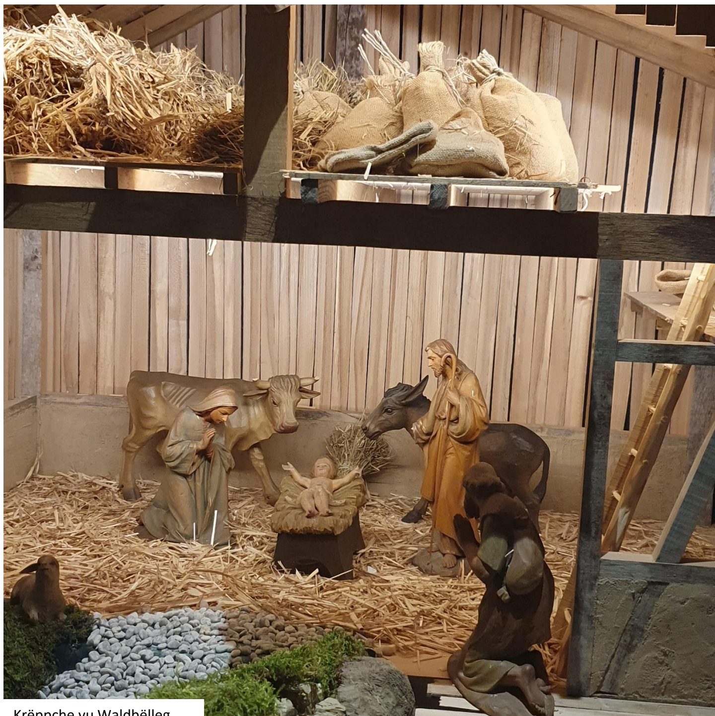
Krippche vu Waldbëlleg