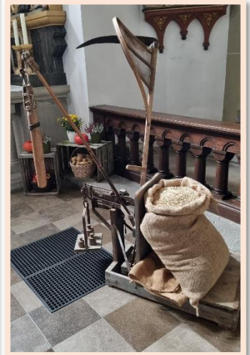
Bilder: Walter Baunach