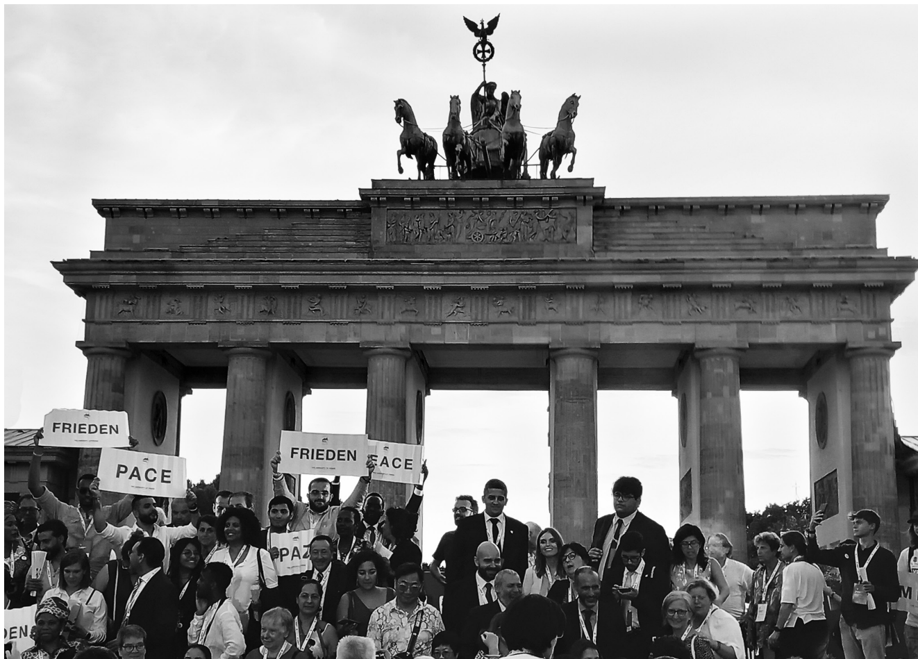
Beim internationalen Friedenstreffen der Religionen in Berlin September 2023.

„Ehre sei Gott in der Höhe und Friede auf Erden den Menschen seines Wohlgefallens.“ Das sind die Worte der Engel an der Krippe zu den Hirten. Das sind Worte, die auch uns heute zugesagt sind als Hirten und Hirtinnen in unserer Zeit, jedem und jeder an seinem Ort und in seinem und ihrem Umfeld.