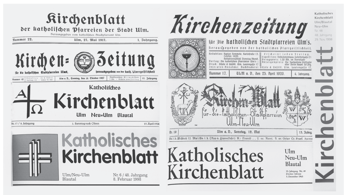
Die Kirchenblätter Ulms.