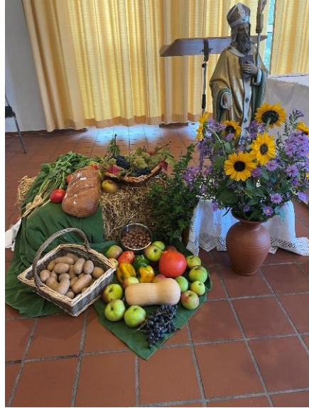
Mesenich, St. Remigius anschl. an den Gottesdienst wurde der Gemeindebus gesegnet