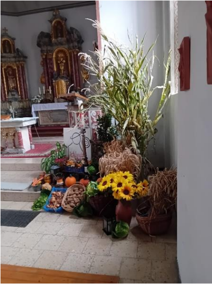
Edingen, St. Lambertus