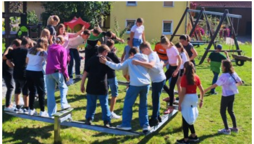
Kennenlerntag der neuen Präpis der Region Uffen- heim Nord mit Teamspielen auf dem wunderschönen Spielplatz des DGH!