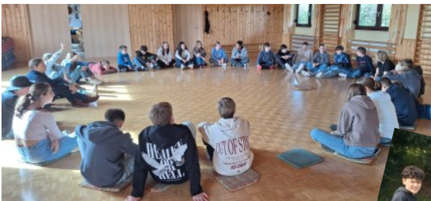
Konfitag der Region Uffenheim Nord zum Thema „Die 10 Gebote“ in der Sporthalle in Gnodstadt mit Frühstückspause beim Gnodstädter Bäcker!