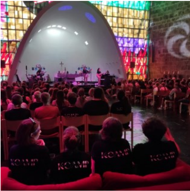
Konficamp Bad Windsheim– Uffenheim auf der Burg Feuerstein in der letzten Woche der Sommerfer- rien, bei dem unsere Konfigruppe Ippesheim–Weigenheim zum dritten Mal in Folge beim „Wetten–dass...“ - Abend Wettkönig wurde!