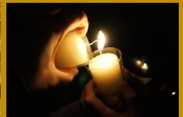
Weihnachtsdarstellung in der Kirche in Guteneck