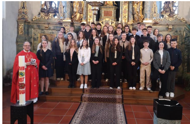
Die Firmlinge aus Füramoos, Mühlhausen und Oberessendorf