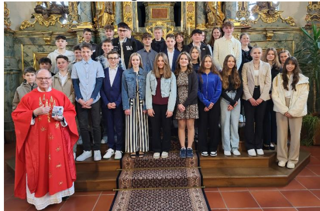
Die Firmlinge aus Eberhardzell