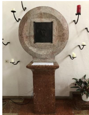
Zu den Hl. 14 Nothelfern