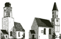
St. Jakobus – St. Georg Unterpeiching Mittelstetten