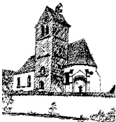
St. Quirin – Staudheim