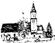
St. Georg – Feldheim