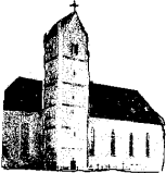
St. Peter und Paul Genderkingen