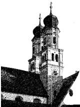
Mariä Himmelfahrt Niederschönenfeld