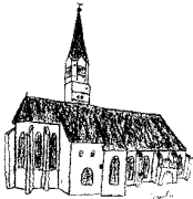
St. Johannes d. Täufer Rain