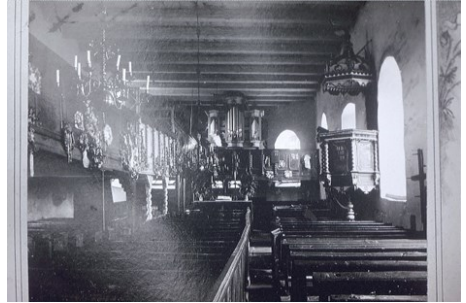
Bild: Die alte Friller Kirche von innen

V. Eine freiwillige kirchliche Sammlung für die Nothleidenden in Oberschlesien (Hungersnoth), sowie für die Hinterbliebenen der bei Zwickau im Königreich Sachsen verunglückten Bergleute, von 86 Mark, mag als patriotische Handlung hier bemerkt werden.