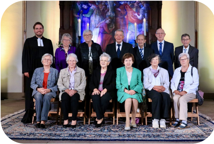
Bild: Eisenreife Konfirmation