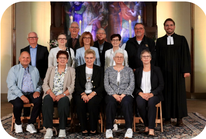
Bild: Goldene Konfirmation