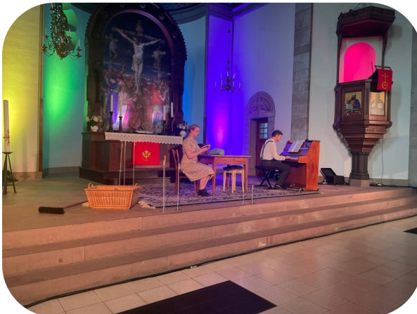
Bild: Die Darsteller während des Stücks