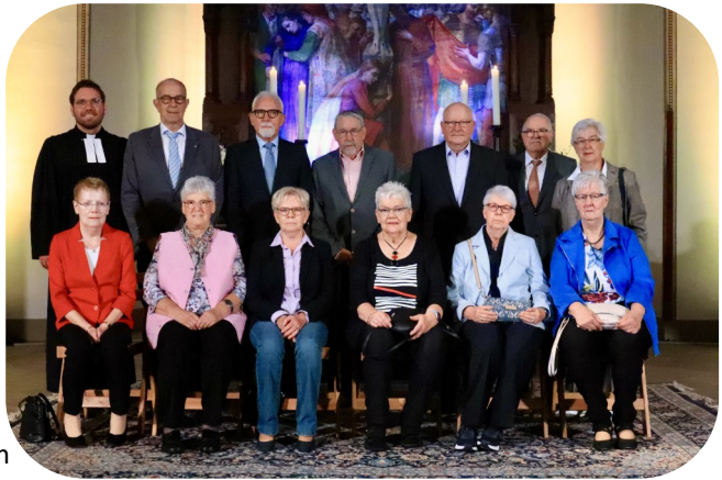
Bild: Diamantene Konfirmation