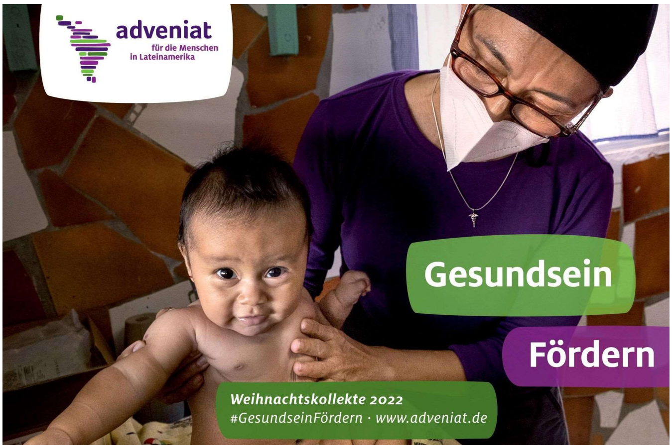
Bild: Gesundheit fördern - Adveniat Weihnachtsaktion 2022