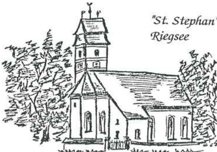
"St. Stephan" Riegsee