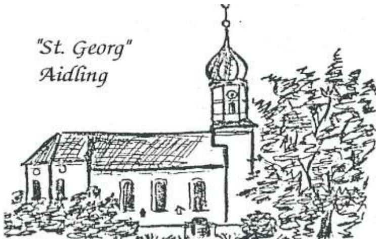
"St. Georg" Aidling