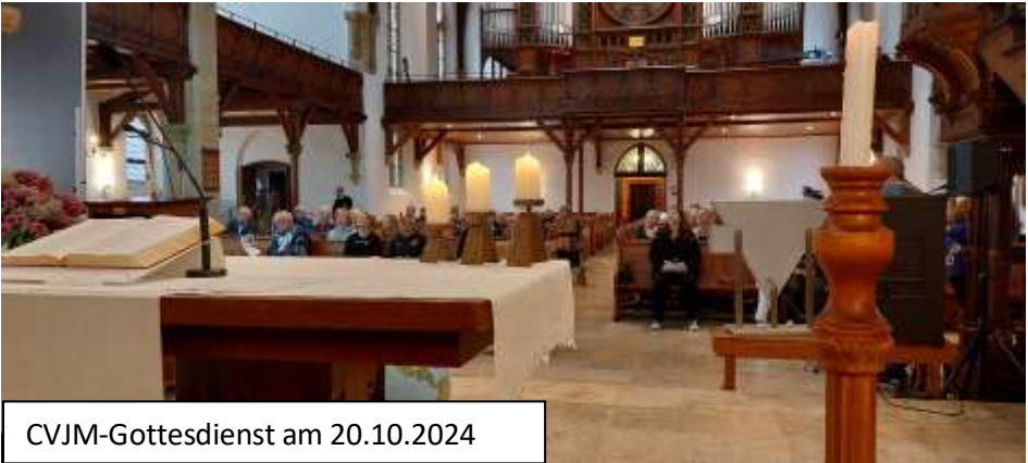
CVJM-Gottesdienst am 20.10.2024