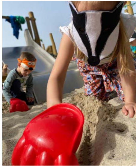
Graben wie Dachs und Fuchs

Kita-Lied „Ein bunter Regenbogen“ bei den beiden Damen vom Naturparkzentrum verabschiedet. Nach zwei erlebnisreichen Stunden ging es dann zufrieden und voll mit neuen Eindrücken mit dem Bus wieder zurück in unsere Kita.