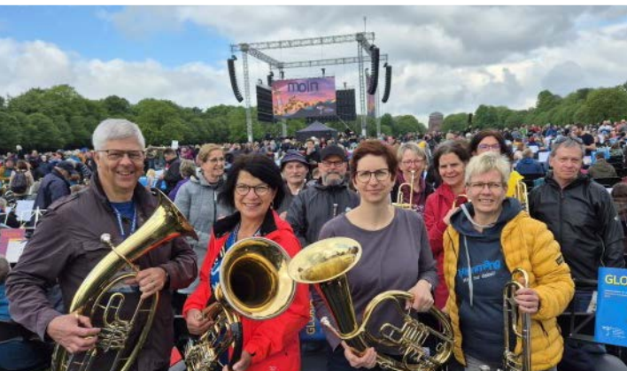
Teilnehmende aus Finsterwalde und Kirchhain