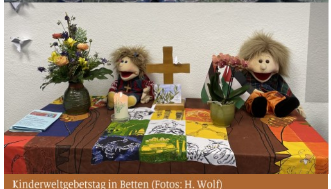
Kinderweltgebets-tag in Betten