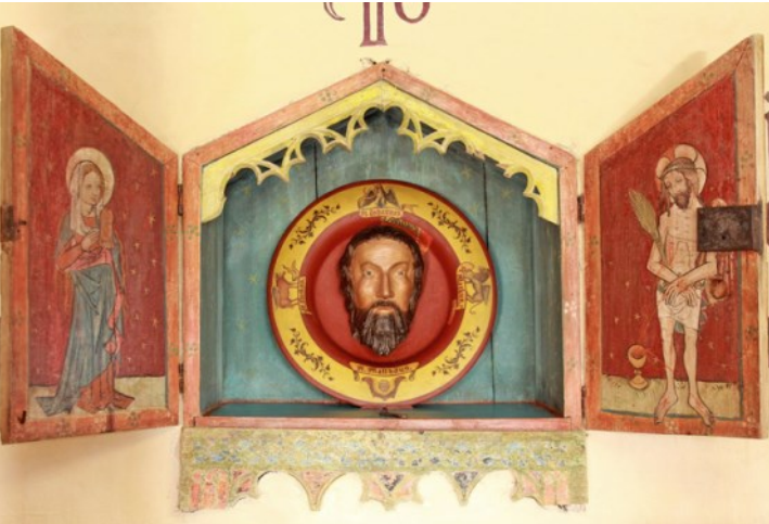
Die Sakramentsnische in der St. Johannes-Kirche Gahro.

Es hat sich bereits herumgesprochen: Unser Pfarrbereich hat sich verändert. Seit fast einem Jahr gehören die Gemeinden Weißack-Gahro und Crinitz-Fürstlich Drehna des ehemaligen Massener Nordens zu uns. Oder wir zu ihnen? Auf jeden Fall hat sich der Zuständigkeitsbereich des Pfarramtes Sonnewalde vergrößert. Natürlich mit Konsequenzen, die aber heute nicht beklagt werden sollen. Doch wer aufmerksam ist, spürt die Veränderungen, die langsam alle Bereiche des gemeindlichen Lebens erfassen. Ab dieser Ausgabe unseres Gemeindeblattes „Rundum Evangelisch“ vollziehen wir nun auch diese Änderungen, sodass Sie, liebe Leser aus den Bereichen des ehemaligen Massener Nordens, Informationen aus Ihren Gemeinden im Bereich des Pfarramtes Sonnewalde finden.