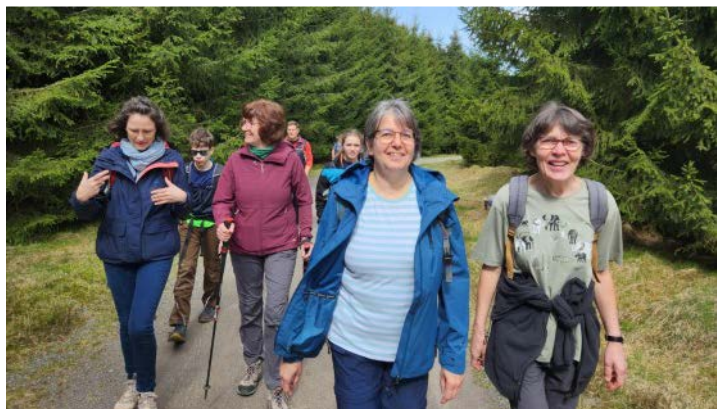
In netter Gemeinschaft unterwegs