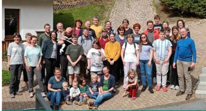
Drei Generationen kamen zusammen für ein Wochenende