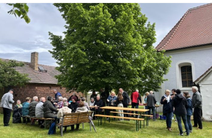
Unter der Linde in Lieskau

Herzlichen Dank für jede Hilfe! Bis zum nächsten Mal!