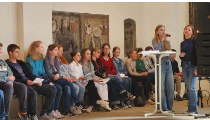
Konzentriert bei der Sache

Sie merken es in Ihrem Alltag schon sehr zeitig: Wir sind schnell dabei, uns in Schubladen zu stecken. Gegenseitige Vorurteile verhindern das aufeinander Hören und miteinander leben. So lag das Thema für den Vorstellungsgottesdienst unserer Konfirmanden am 28. April in diesem Jahr ziemlich nah. Eingeladen waren neben der Gemeinde, den Gemeindegemeinderäten natürlich auch Eltern, Großeltern und Paten der Konfirmanden. Sehr selbstbewusst und souverän gestalteten die Konfirmanden mit ihren eigenen Texten mit kleinen Anspielen und mit viel handgemachter Musik ihren Gottesdienst. Raus aus den Schubladen: Jesus hätte es genauso gemacht, er hat sich gerade den Menschen zugewendet, die in den Schubladen zu verschwinden drohen. Und in welche Schublade steckt uns eigentlich Gott?