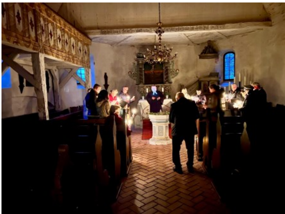
Ostermorgen in Großkrausnick