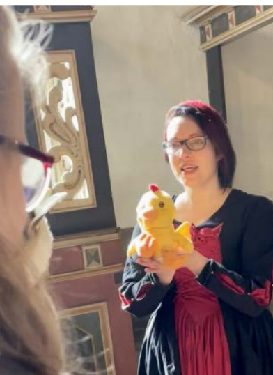
Die Königstochter Katharina