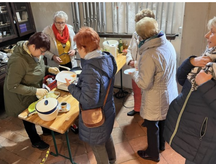
Plinsfrühstück vor dem Gottesdienst in Massen