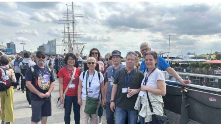
Pause auf der Jan-Vedder-Promenade