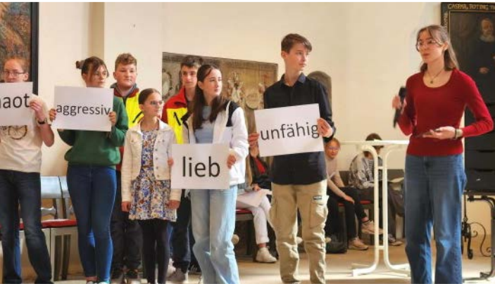
Im Anspiel wurden Menschen in Schubladen gesteckt