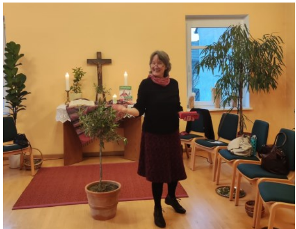
Bei den Vorbereitungen zum Weltgebetstag