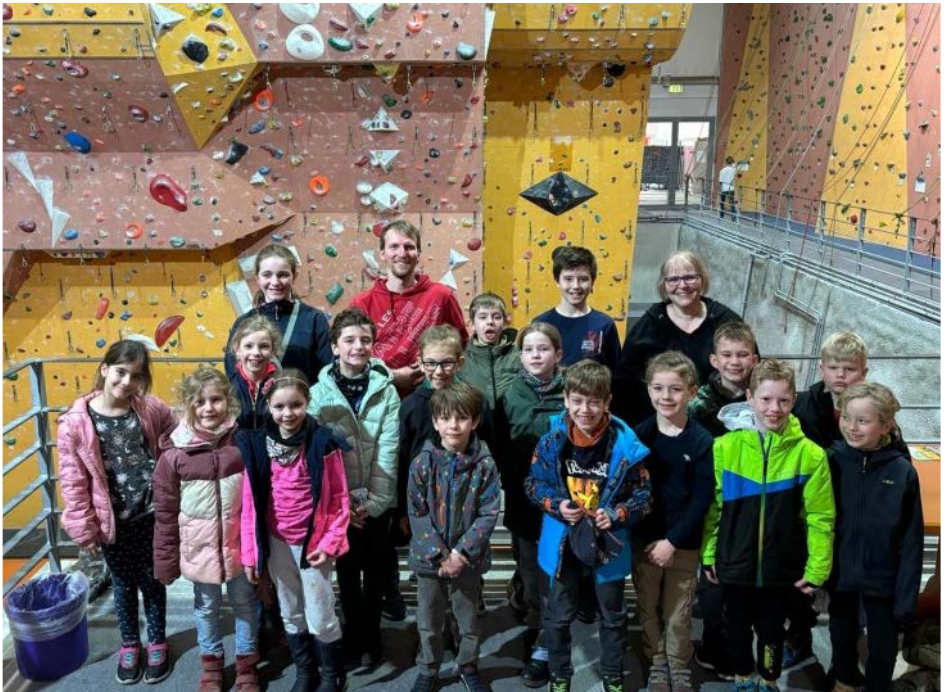
Im Kletterpark in Dresden