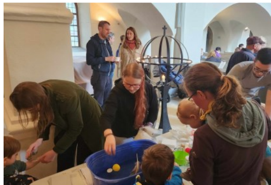
Viele Angebote in der Kirche