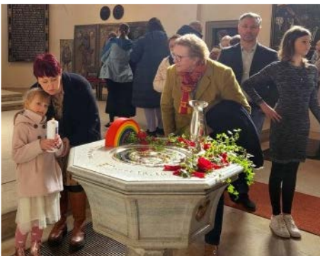
Erinnerung am Taufstein