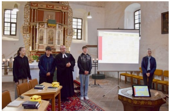
Vorstellung der Konfirmand:innen in Goßmar