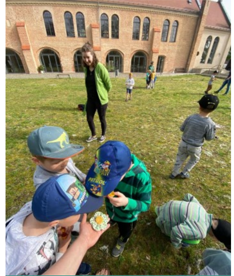
Geruchsproben wurden zugeordnet

Die Erzieherinnen unserer Kita hatten wieder einen tollen Ausflug für unsere Vorschulgruppe geplant. 17 Kinder, zwei Auszubildende und zwei Erzieherinnen machten sich auf den Weg in das Naturparkzentrum erlebnisREICH im Schloss Doberlug. Wie kamen alle dort hin? Natürlich mit dem Bus. Schon die Busfahrt ist immer ein kleines Erlebnis und Abenteuer für die Vorschulkinder. In Doberlug angekommen, wurde erst einmal das große Schloss von außen bestaunt. Dort warteten schon zwei Damen vom Naturparkzentrum. Und dann ging es auch schon los. Thema des Ausfluges war „Zeig mir,