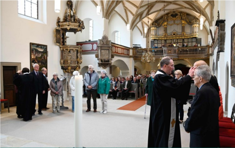
Segnung der Jubiläumskonfirmanden und –konfirmandinnen