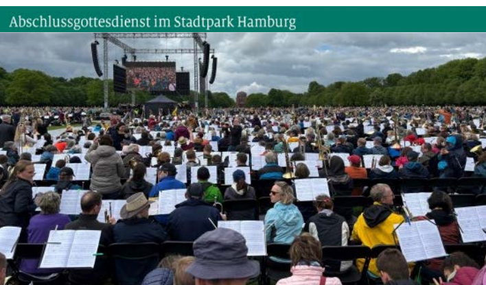
Abschlussgottesdienst im Stadtpark Hamburg

Nach Leipzig (2008) und Dresden (2016) trafen sich diesmal zum 3. Deutschen Evangelischen Posaumentag (DEPT) über 15.000 Bläserinnen und Bläser am ersten Maiwochenende in Hamburg.