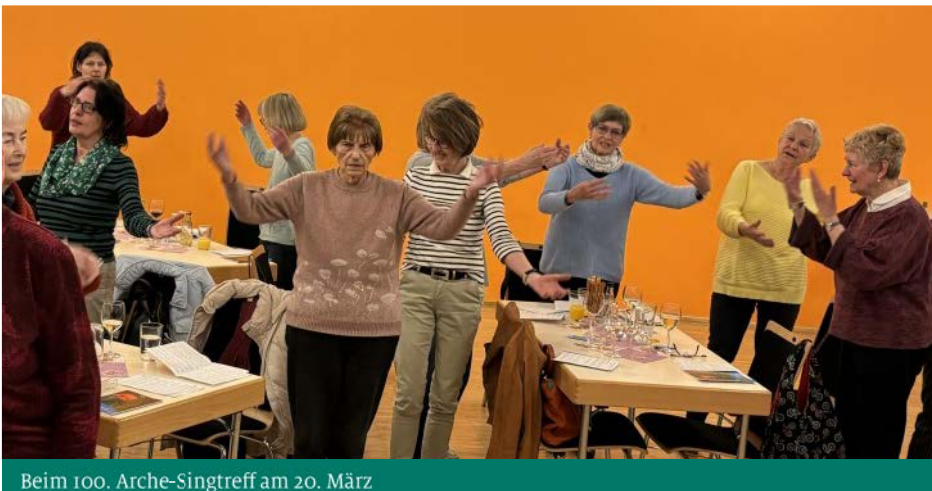
Beim 100. Arche-Singtreff am 20. März