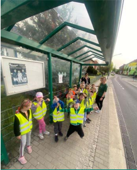
Warten auf den Bus

Die Erzieherinnen unserer Kita hatten wieder einen tollen Ausflug für unsere Vorschulgruppe geplant. 17 Kinder, zwei Auszubildende und zwei Erzieherinnen machten sich auf den Weg in das Naturparkzentrum erlebnisREICH im Schloss Doberlug. Wie kamen alle dort hin? Natürlich mit dem Bus. Schon die Busfahrt ist immer ein kleines Erlebnis und Abenteuer für die Vorschulkinder. In Doberlug angekommen, wurde erst einmal das große Schloss von außen bestaunt. Dort warteten schon zwei Damen vom Naturparkzentrum. Und dann ging es auch schon los. Thema des Ausfluges war „Zeig mir,