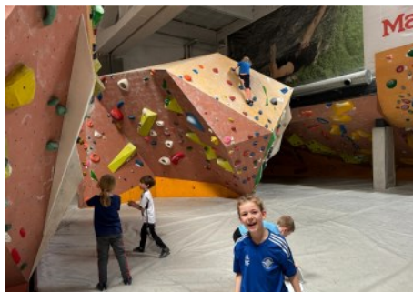
Mit viel Spaß dabei