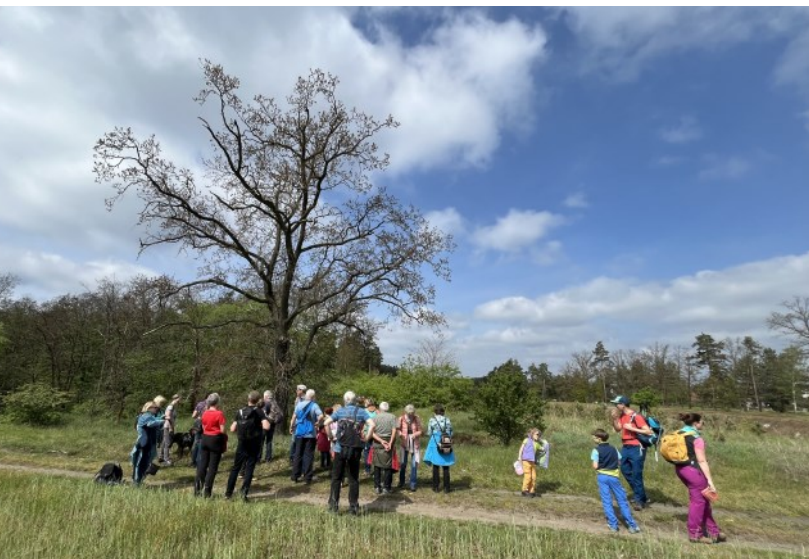
Wanderung rund um Altdöbern