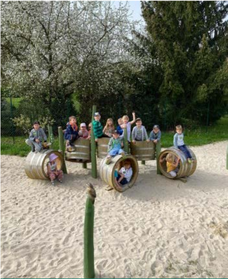
Auf dem Spielplatz

macht, gab es zwischendurch eine kleine Obstpause auf dem naheliegenden Spielplatz. Dieser wurde natürlich auch noch rege bespielt. Die Kinder durften selbst einmal wie Dachs und Fuchs mit Krallen im Sand graben. Nach der guten Stärkung gab es die nächste Aufgabe für die Kinder. Es wurden Vogelstimmen gehört, verschiedene Nester betrachtet und die passenden Vögel mussten zugeordnet werden. Da wurden an diesem Tag wirklich alle Sinne der Kinder beansprucht! Zum Schluss gab es noch ein Katz-und-Vogel-Fangspiel.