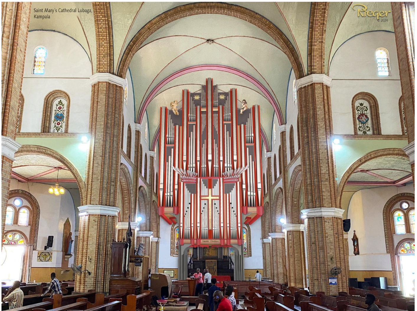
Modellsimulation der neuen Orgel