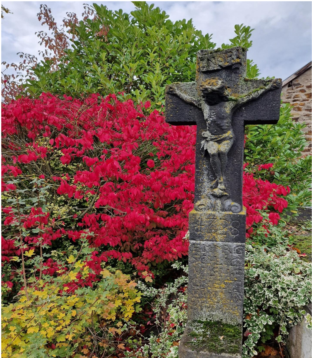
Kapelle in Gleys; Foto: Wolfgang Doll