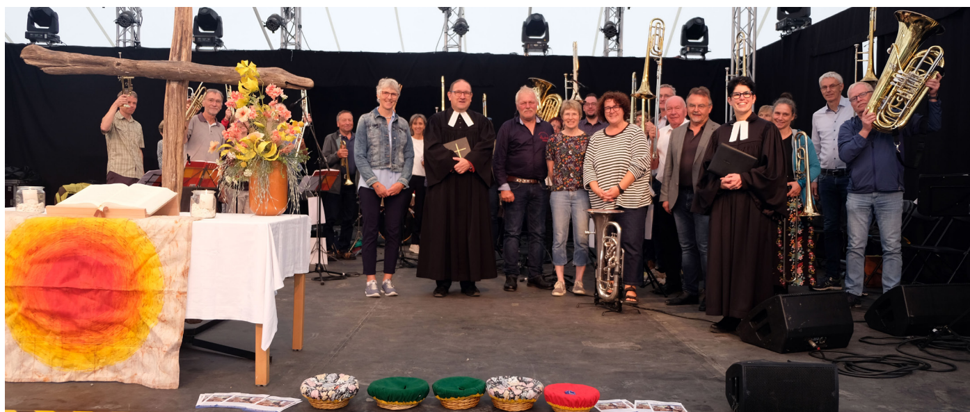
Foto (bawa) von der Landes-Gartenschau Wangen - Text siehe Seite 2

Bleiben Sie in allen Aufbrüchen behütet – wünscht Pfarrer Friedemann Glaser mit dem Redaktionsteam