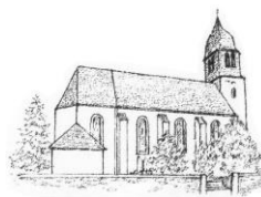
St. Peter und Paul Peterswald-Löffelscheid