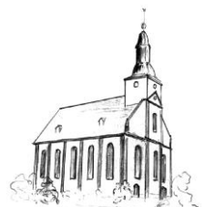
St. Philippus und Jakobus Mittelstrimmig