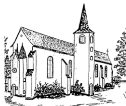
Maria Himmelfahrt Blankenrath