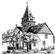
St. Cornelius und Cyprian Tellig