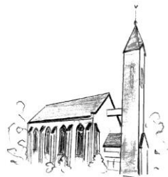
St. Matthias Grenderich