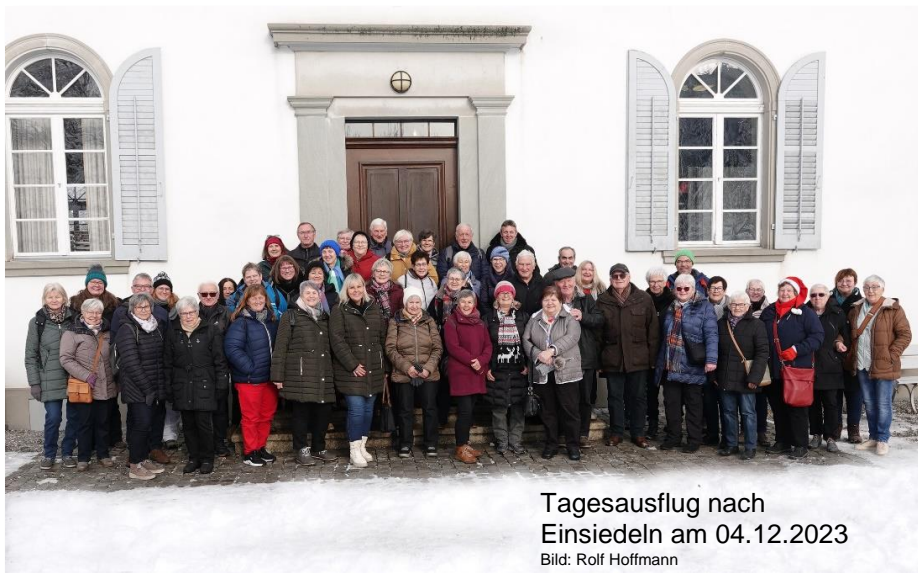
Tagesausflug nach Einsiedeln am 04.12.2023