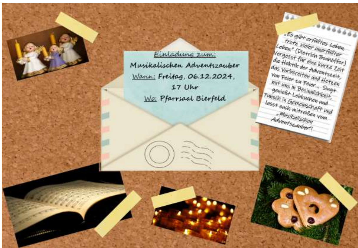
Plakat erstellt von Annika Blatt