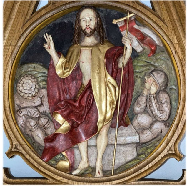
Relief von der Auferstehung Christi im Hochaltar von St. Margaretha Bolsdorf. Dieses Relief ist eine Nachbildung aus dem Rosenkranz von Veit Stoß (1447 – 1533)

In den Vereinigten Staaten stellt ein gewählter Präsident die Jahrzehnte alte und bewährte Weltordnung auf den Kopf und niemand scheint ihn stoppen zu können. Der Krieg vor unserer Haustür, in der Ukraine scheint nicht mehr enden zu wollen. Die Europäische Union ist schon seit langem nicht mehr in der Lage mit einer Stimme zu sprechen. Und das Leiden im Heiligen Land scheint kein Ende nehmen zu wollen. In Myanmar und Thailand werden innerhalb weniger Sekunden hunderte Menschen aus dem Leben gerissen.