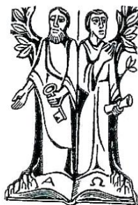
hll. Petrus u. Paulus