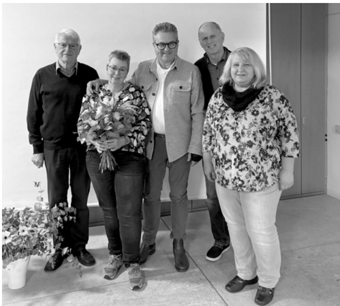
Neue Vorstände der Aktion „Freunde schaffen Freude e. V.“