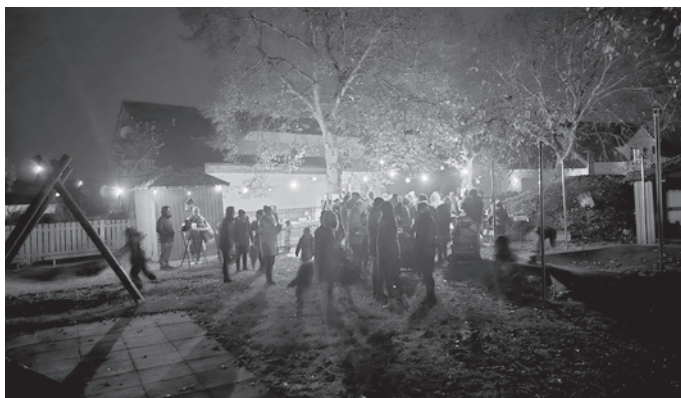
St. Martinsfest Dunstelkingen

Ein wunderschönes St. Martinsfest konnten wir trotz des schlechten Wetters wieder in diesem Jahr in Dunstelkingen feiern. Nach einem Gottesdienst in der Kirche, den die Kinder mitgestalten durften, wurde das Lied „Kommt wir woll'n Laterne laufen“ angestimmt. Mit den Laternen zogen wir hinter unserer Martinsreiterin durch's Dorf. An der Bushaltestelle fand traditionell die Mantelteilung statt. Im Garten des Kindergartens hatte der Kindergarten, mit tatkräftiger Unterstützung des Elternbeirats und aller Eltern zu Punsch, Glühwein und Fingerfood eingeladen, um das Fest gemütlich ausklingen zu lassen. Allen helfenden Händen, der Freiwilligen Feuerwehr und unserer „Gänsebäckerin“ sagen wir hiermit von Herzen Dankeschön und ein Vergelt's Gott!