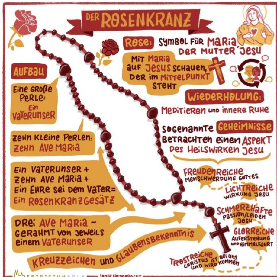
11.07.2022 Ave Maria, Beten, Gebete, Grafiken Farbe