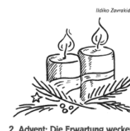
2. Advent: Die Erwartung wecken