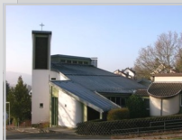
Zur Schmerzhaften Mutter Gottes Lsipenhausen (L) Schützenweg 4