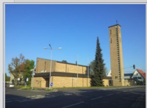
Christus der Erlöser Rotenburg (R) Mündershäuser Str. 1