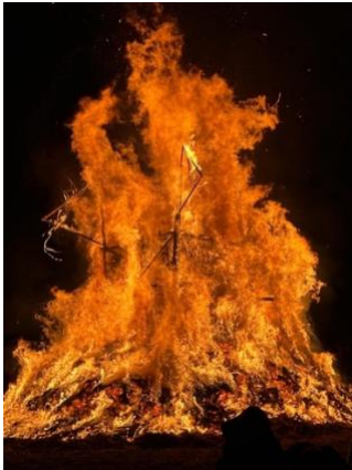
Quell: Paroisse St Martin

08.03.2025 - Home Saint Jean zu Diddeleng