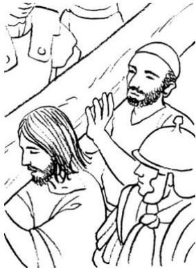
@ Jean-François Kieffer

Fir all Familljen aus de Paren Käldall an Diddeleng