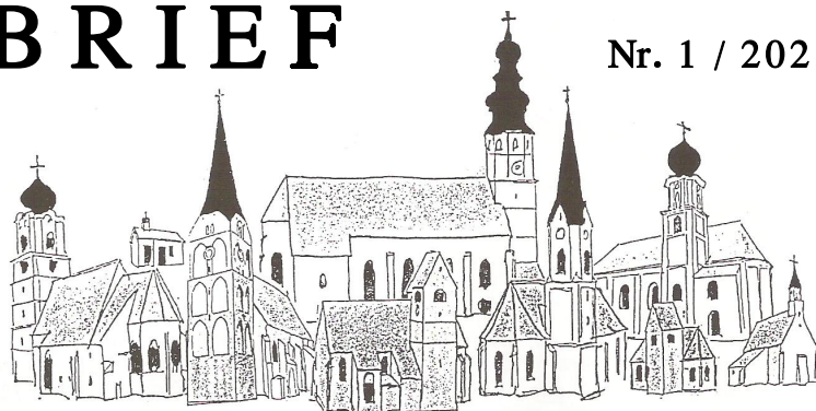
Wolfakirchen – Uttlau – Raining – Haarbach

Jesus, Gottes Sohn, der Retter der Welt, ist uns geboren!