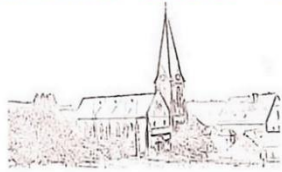
St. Antonius Maßweiler