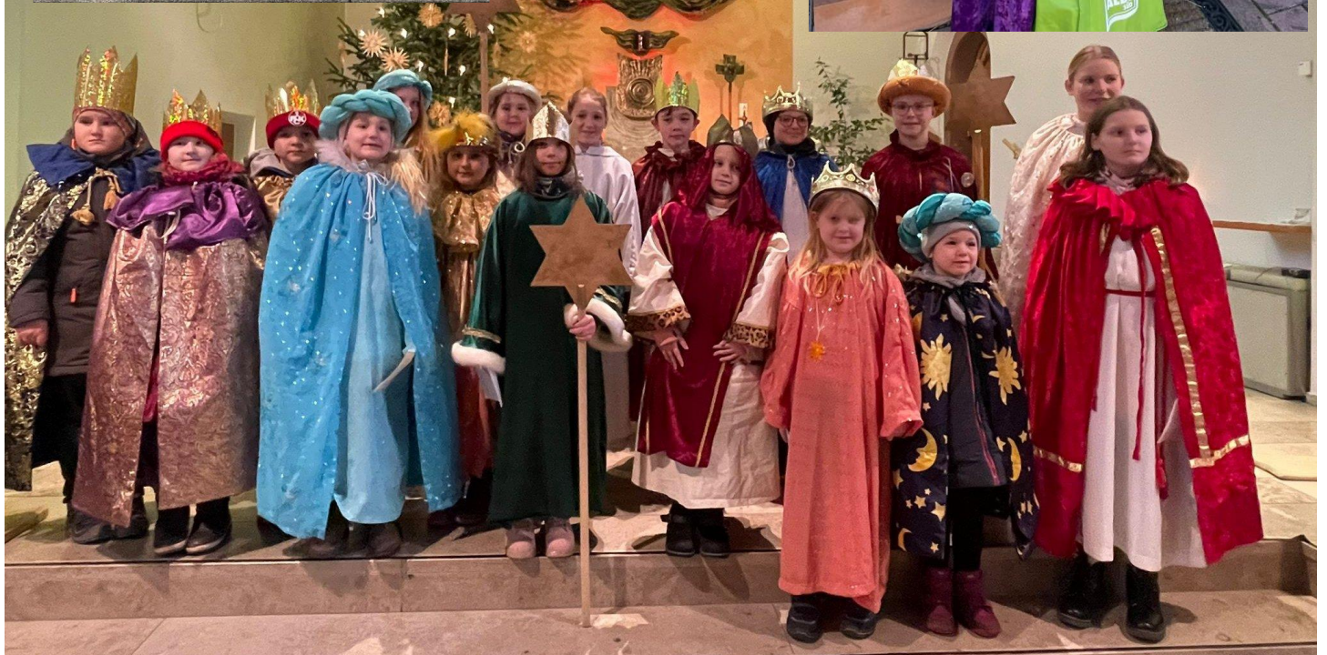
Sternsinger/innen beim Abschlußgottesdienst in Thaleischweiler-Fröschen