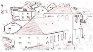
St. Margaretha Thaleischweiler-Fröschen