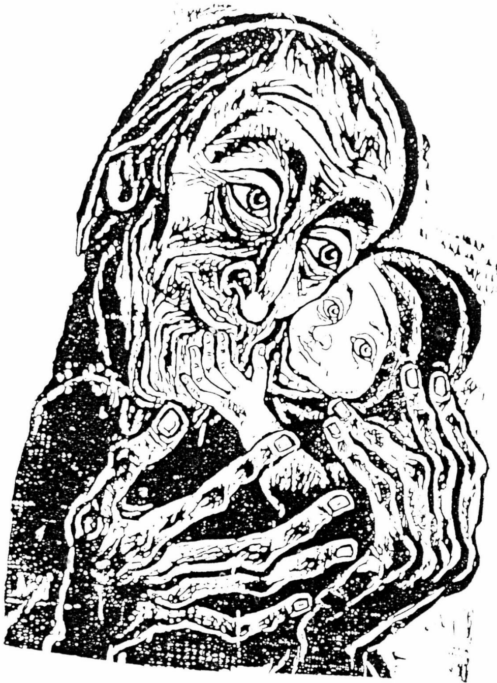
Simeon und das Kind (Walter Habdank)