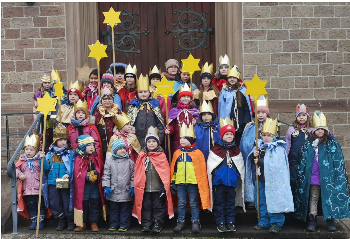
Sternsinger/innen in Maßweiler