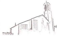
St. Peter Petersberg