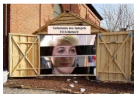
Der besondere Ort an der Godehard-Kirche in Ochtersum