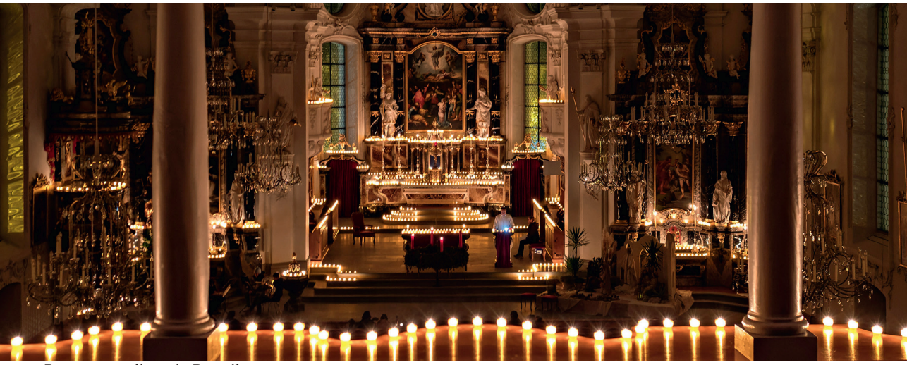
Rorategottesdienst in Ruswil.