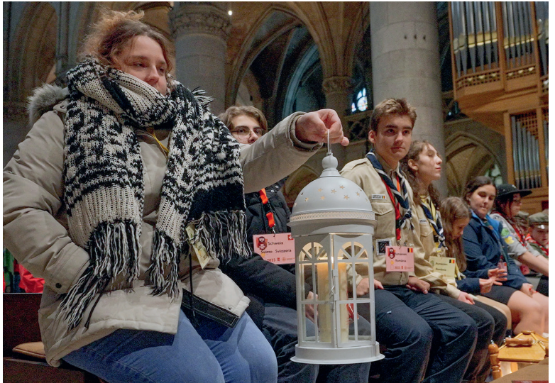
Jugendliche bei der Abholung des Friedenslichts 2023. Diese fand damals in Linz statt.