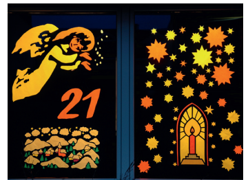
Adventsfenster im Quartier gehen oft von Pfarreien aus.