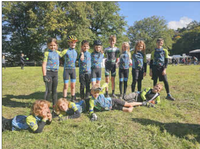
Unsere Jüngsten bei Abschluss in Yutz

Die Mountainbike-Saison ist zwar vorbei, aber die Cyclocross-Saison hat gerade erst angefangen. Unser erstes Heimrennen in Perl findet am 07. Dezember 2024 statt. Mehr Infos unter www.perlcross.de