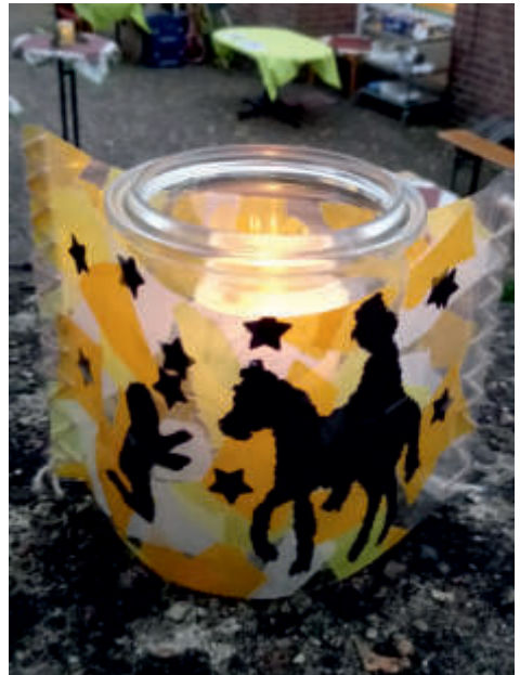
Windlichter grüßen zum Martinsfest.

Bad Driburger schauten von Balkonen zu und genossen den Anblick so vieler Laternen.