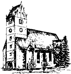
St. Cornelius u. Cyprian