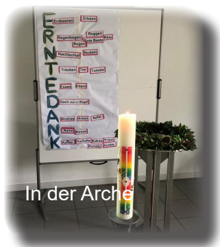
In der Arche