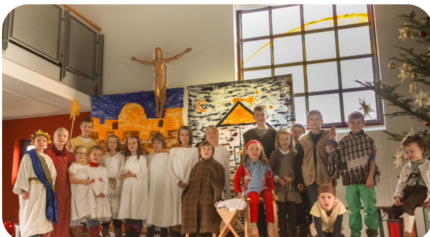
Krippenspiel in der Arche 2015