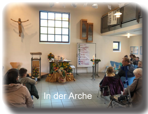
In der Arche