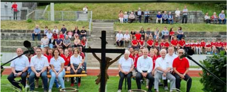
111 Jahre TSV Flossenbürg: Ökumenischer Gottesdienst