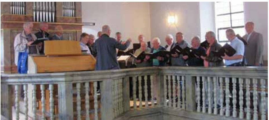
Männergesangsverein: Konzertgottesdienst in Flossenbürg