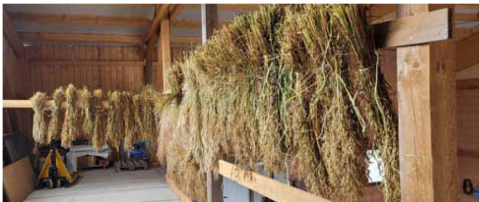
Hier entsteht eine neue „Erntekrone“