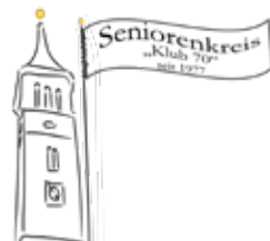
Zu Besuch bei der Flosser Feuerwehr