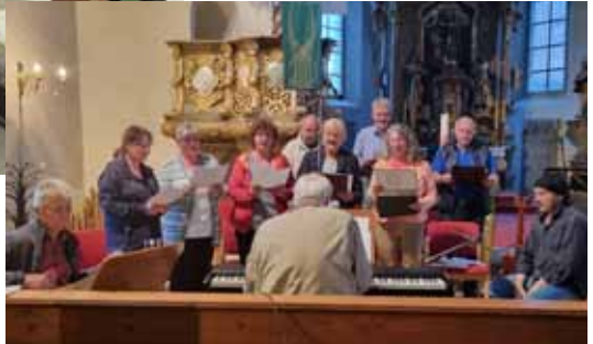
Lobpreisgottesdienst in Floß mit Chor und Kirchenband