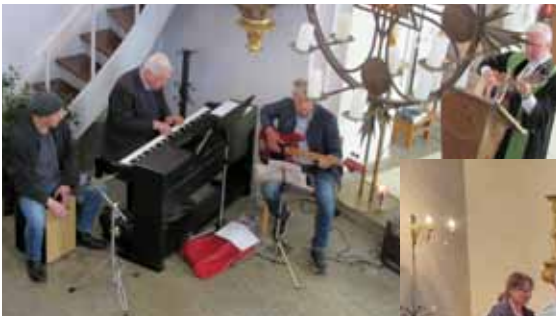
Kirchenband in Flossenbürg