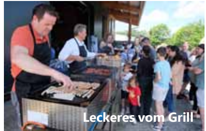
Leckeres vom Grill