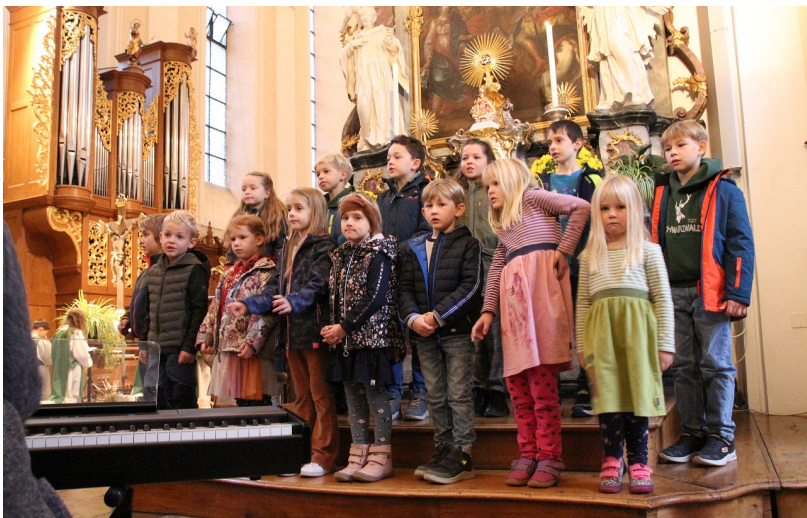
Kinderchor St. Trudpert