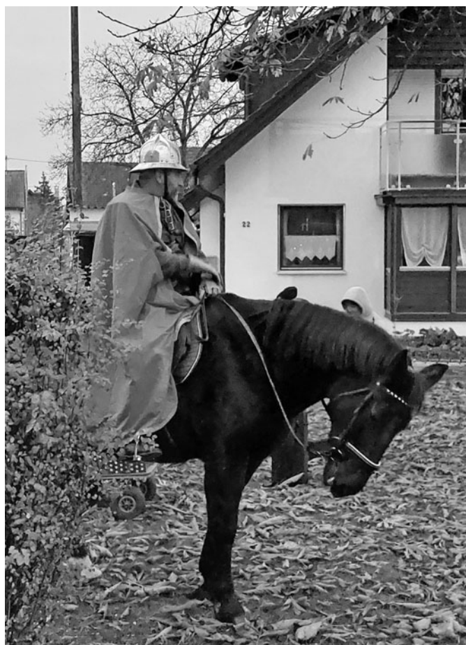
Herzliches Vergelt's Gott allen die sich an dem tollen St. Martin Fest in Oberdorf so vielfältig engagiert haben.