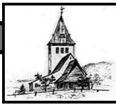
St. Jodokus Bad Oberdorf