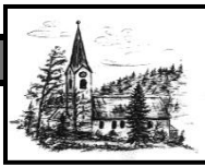
Heiligste Dreifaltigkeit Unterjoch