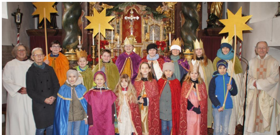
Die Pettendorfer und die Kneitinge Sternsinger

Der Erlös der Sternsingeraktion unterstützt benachteiligte Kinder in Kenia und Kolumbien.