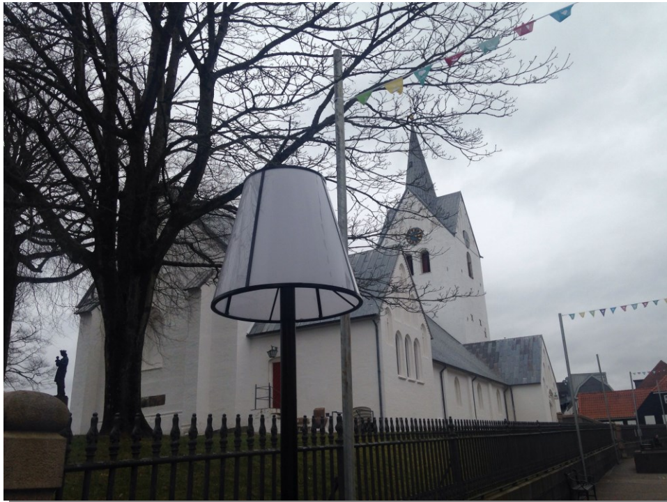
Auch Reisen ins hyggelige Nachbarkönigreich Dänemark sind wieder möglich. Hier die Thistedter Kirche in Nordjütland mit "Erleuchtung"

Die vergangenen Ferien und behördlich verordneten Unterbrechungen, haben für mich persönlich die Präsenz des Gebets in unserer tagsüber geöffneten St. Franziskus und Heilig Geist Kirche verdeutlicht.