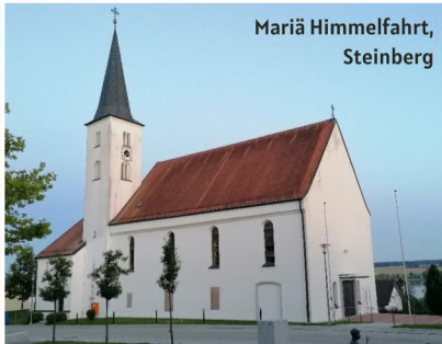
Mariä Himmelfahrt, Steinberg