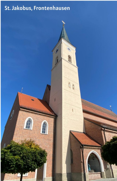
St. Jakobus, Frontenhausen