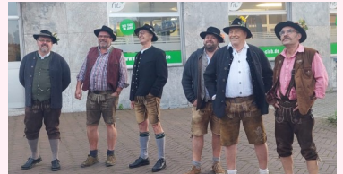
Die Böllerschützen begrüßten mit Salut-Schüssen