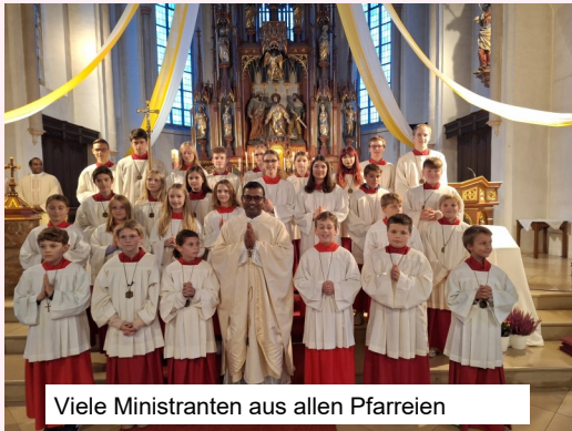
Viele Ministranten aus allen Pfarreien