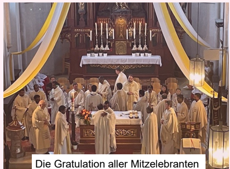
Die Gratulation aller Mitzelebranten