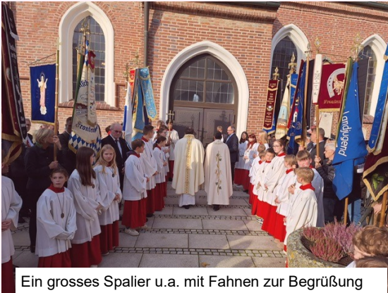
Ein grosses Spalier u.a. mit Fahnen zur Begrüssung