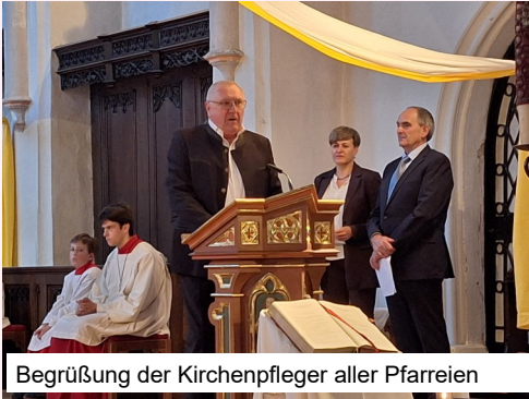
Begrüßung der Kirchenpfleger aller Pfarreien