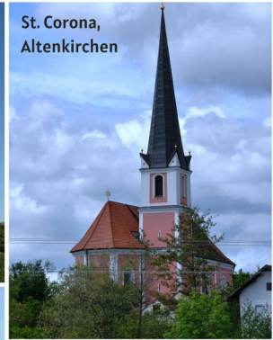
St. Corona, Altenkirchen