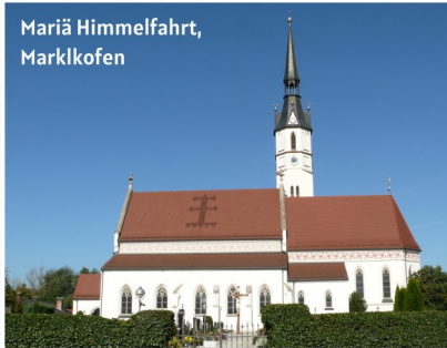
Mariä Himmelfahrt, Marklkofen