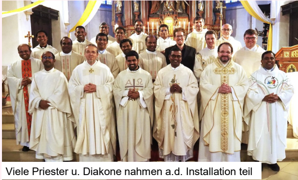
Viele Priester u. Diakone nahmen a.d. Installation teil