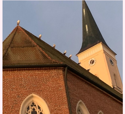
Sogar die Störche bildeten ein Spalier