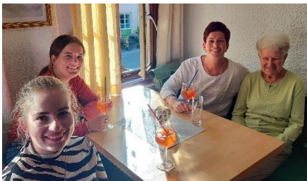
Drei Generationen an einem Tisch!