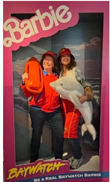
In der Selfie-Ecke