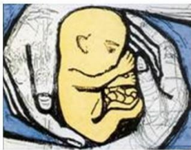
Beratungsstelle Aus-WEG?! Hilfe zum Leben Pforzheim e.V.

Wir werden die eingenommenen Spenden an die Schwangerenberatung Aus-WEG?! in Pforzheim überwiesen. In dieser Beratungsstelle finden Frauen, die ungewollt schwanger sind, Rat und Hilfe. Für Frauen, die unter den Folgen eines Schwangerschaftsabbruches leiden, steht diese Beratungsstelle ebenfalls offen. Ihnen steht ein therapeutisches Angebot zur Verfügung. Die Beratungsstelle Aus-WEG?! finanziert sich ausschließlich über Spenden und gehört zum Verein „Hilfe zum Leben Pforzheim e.V.“.