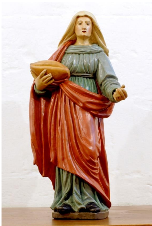
Heilige Elisabeth von Thüringen