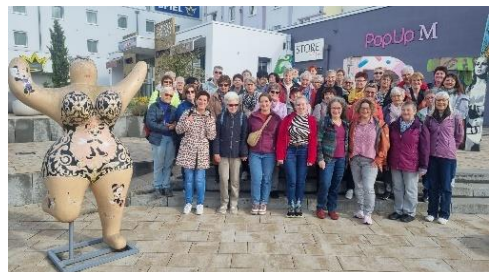
51 Teilnehmerinnen hatten ihren Spaß beim Ausflug nach Bad Wimpfen