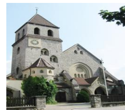
Kolumbarium Hl. Herz Jesu

Nußriede 21, 30627 Hannover Tel. 0511 955 990