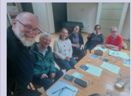
Das Redaktionsteam bei der letzten Planungssitzung für die „offene gemeinde“ 326.

unter 50%. Den Gottesdienst besucht eine kleine Schar, zum größten Teil ältere Semester. Diesen Veränderungen muss auch eine Pfarre und ihre Öffentlichkeitsarbeit Rechnung tragen. Der Großteil der Bezieher der offenen gemeinde hat kaum einen Bezug zur Pfarre.