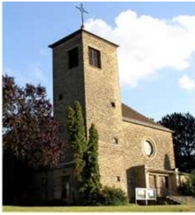
Hl. Familie, Rentrisch