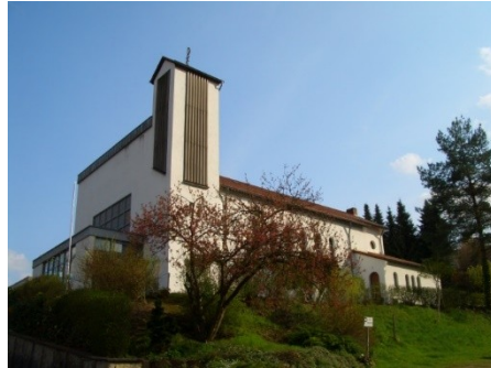
St. Ursula, Scheidt