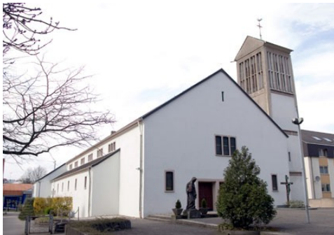
St. Theresia Schafbrücke/Bischmisheim