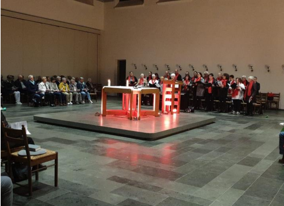
Die Happy Gospels sangen am 27. Oktober (Sonntag) in der Begegnungskirche in Köllerbach. Der Gottesdienst stand unter dem Motto: „Den Sonntag heiligen, mit leichtem Gepäck“. Im Gepäck hatten der Chor alt bekannte Gospels. Text und Foto: Karin Groß