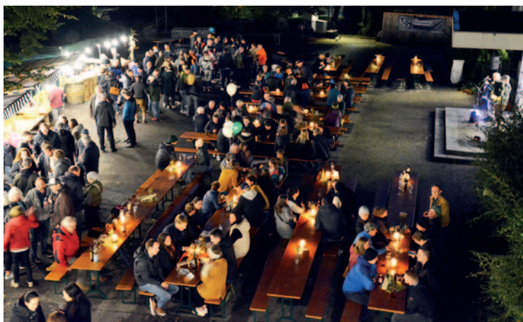
Oktoberdorf, Wolfgang Klocker