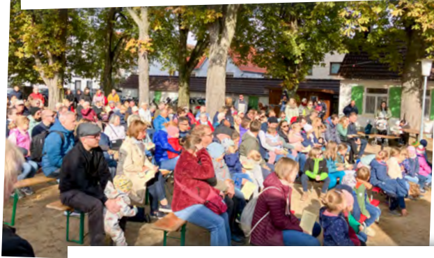
Ökumenischer Freiluftgottesdienst, gestaltet von Kitais & Schokis