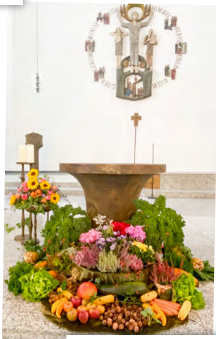
Erscheinung des Herrn