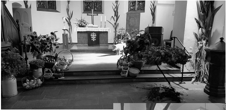
Foto-Rückblick auf die Erntedankfeste